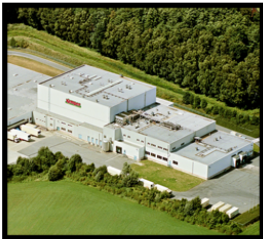
Inbetriebnahme Werk II Kleine Heide, 1995. Die modernste Rohwurstproduktion Europas.