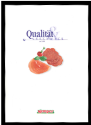
Kemper Anzeige, 1992