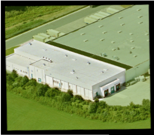
Erweiterungsbau für die Convenienceproduktion, 2006