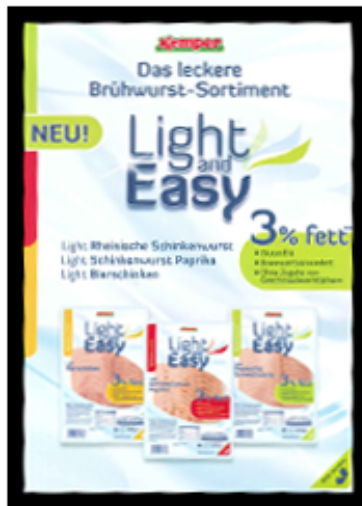
Kemper Light & Easy Brühwurstsortiment mit Ø 3% Fett