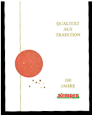
Anzeige zum 100. Jubiläum, 1988