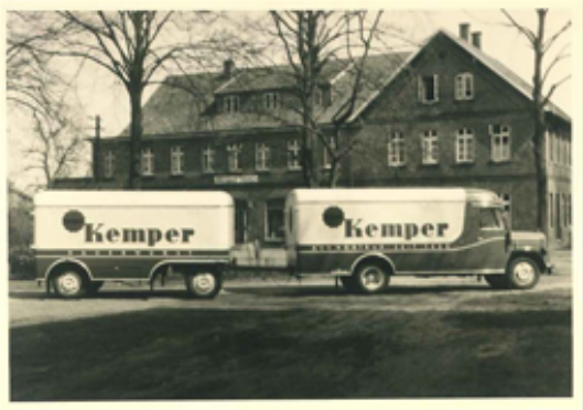
Innovative Transportlogistik, 1964