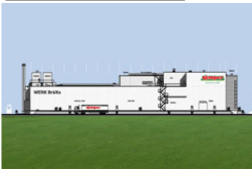
Baubeginn des neuen Werks für Brühwurst- und Kochschinkenprodukt am Standort Nortrup, 2010