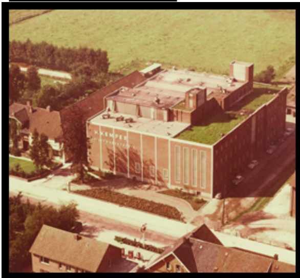
Werk 1 am Standort Nortrup, 1963