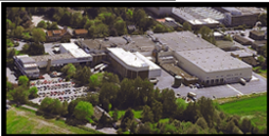
H. Kemper GmbH & Co. KG Werk I, 1993