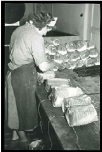
Handwerkliche Rohschinkenfertigung, 1940